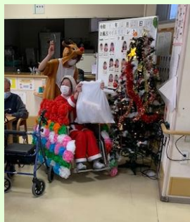
サンタとトナカイが、順番にプレゼントをお配りしました！

12/22(水)にクリスマス会を行いました。サンタクロースと天使のキャンドルサービスで、クリスマスの雰囲気を楽しんでいただきました。