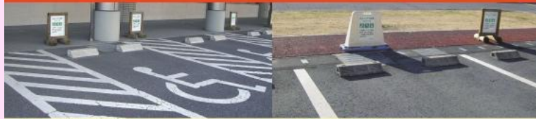
幅3.5m以上の駐車区画

おもいやり駐車スペース この駐車スペースは、栃木県発行の「おもいやり駐車スペース利用証」をお持ちの方が利用できます。